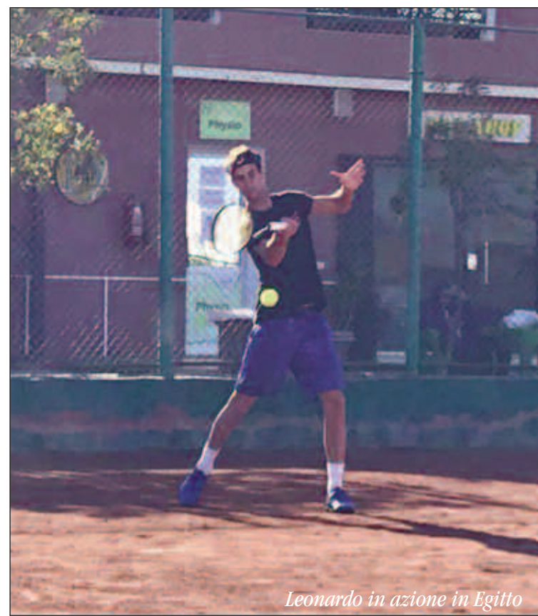
Leonardo in azione in Egitto

In questo momento l'importante è crearsi l'opportunità di affrontare questo genere di partite più possibile per capire cosa serve per competere a questo livello con continuità. Stà affrontando avversari di livello internazionale con molta più esperienza, la sensazione è quella di non esserne poi così lontano; di partita in partita dovrà migliorare dal punto di vista della prestazione, ciò significa fare tesoro e prendere insegnamento dall'esperienza vissuta velocemente, non tanto con il fine del risultato e superare determinati ostacoli per trovare dentro di sé il temperamento, l'equilibrio e la voglia di arrivare, non basta la conoscenza occorre carattere, ci si gioca sempre la fiducia e la consapevolezza di se stessi, in palio c'è soprattutto l'autostima, se non è un bivio può sempre essere un momento di svolta, ogni partita