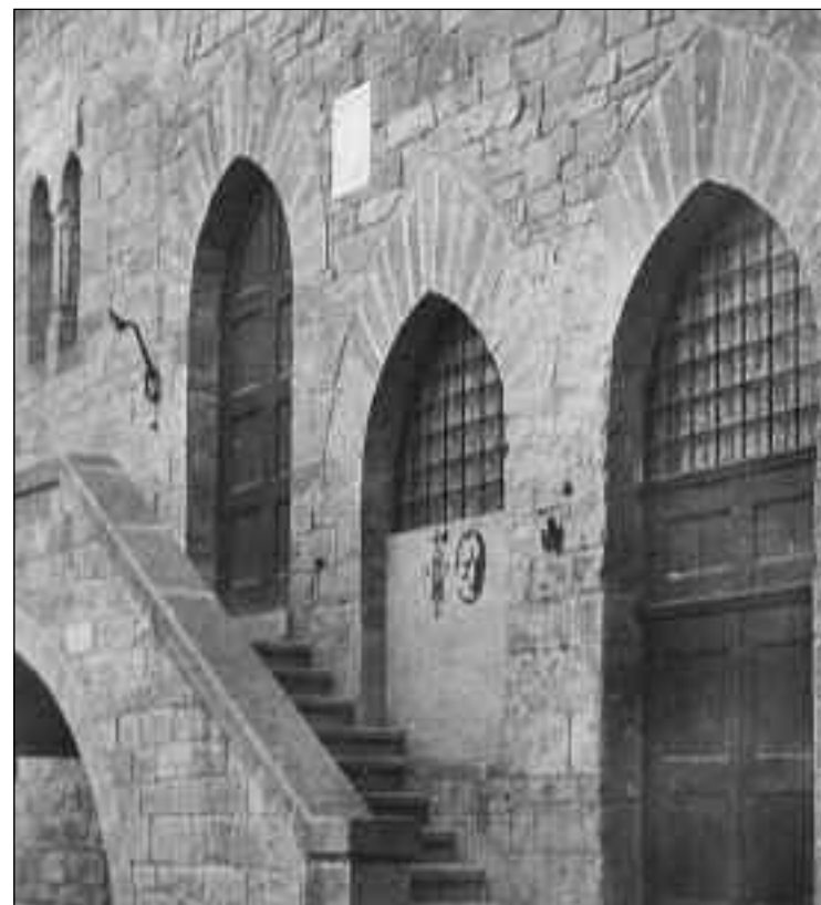
Cortona, ingresso Palazzo del Comune lato Piazza Luca Signorelli, 1944.