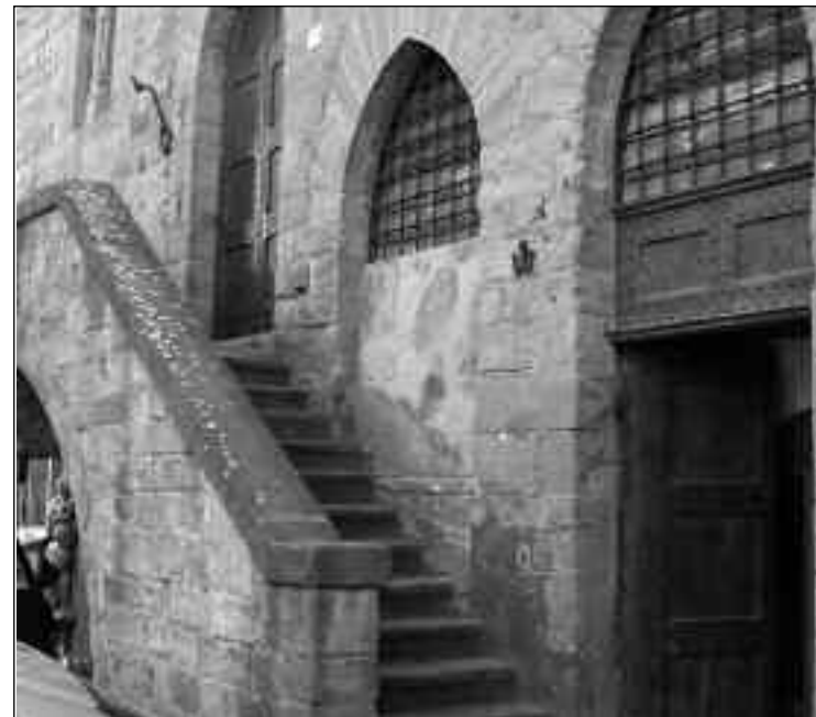
Cortona, ingresso Palazzo del Comune lato Piazza Luca Signorelli, 2008.