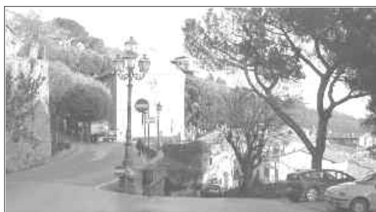
Cortona, 2012. Chiesa di S. Domenico e Borgo.