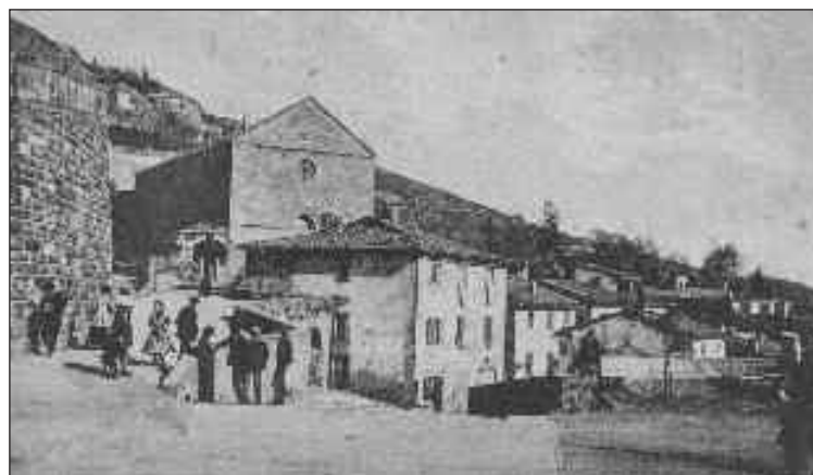
Cortona 1915. Chiesa di S. Domenico e Borgo.