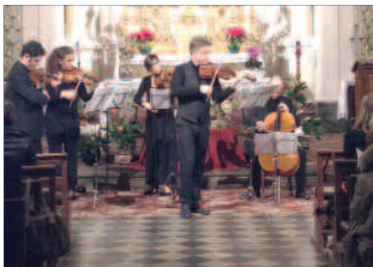
L'Ensemble Hubay durante il Concerto Barocco nella Chiesa di San Filippo