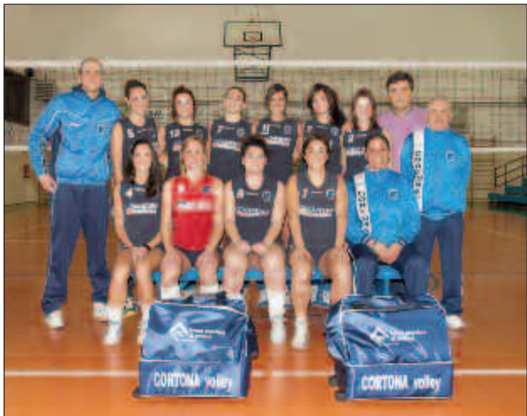
La squadra femminile di serie D

Al termine del girone di andata la squadra allenata da Enzo Sideri si trova al quarto posto in classifica con un ottimo rullino di marcia nelle ultime gare che fa ben sperare per il rendimento nel girone di ritorno che comincerà sabato 28 gennaio a Conselice.