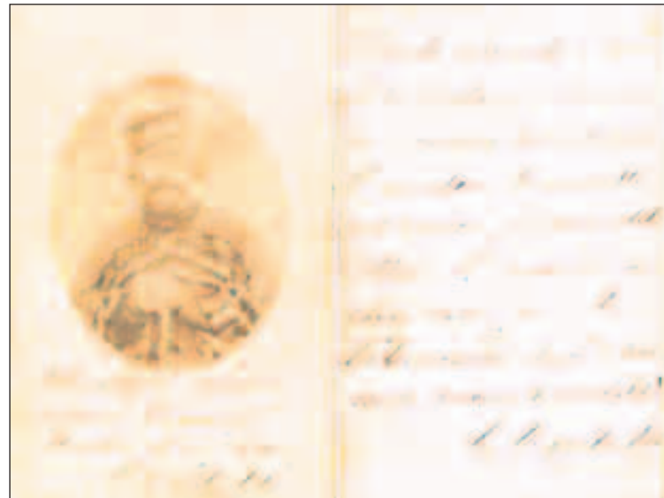
Frammento di lettera inviata da Garibaldi alla madre di un soldato mortogli accanto durante la battaglia di Bezzecca