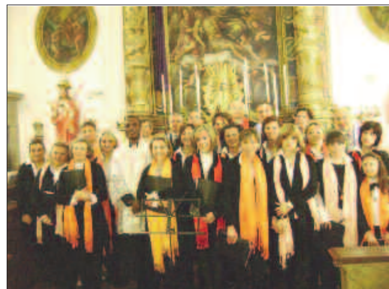
La Corale "Stella del mattino" nella Chiesa superiore di San Marco

Clima Sistemi di Angori e Barboni S.r.l. Vendita e assistenza tecnica Riscaldamento e Condizionamento P.zza Sergardi, 3 - Camucia Tel. 0575/63.12.63 Socio sostenitore "Amici di Francesca"