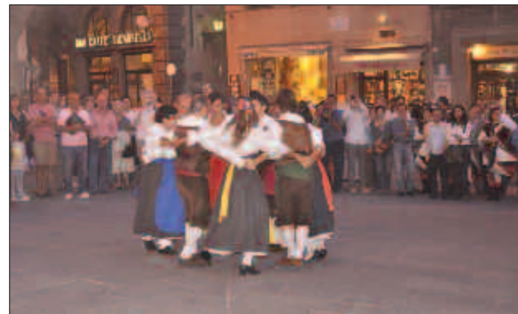
Cortona, 24 settembre 2011: Il Cilindro si esibisce durante una commemorazione di Garibaldi nell'allora Piazza della Repubblica oggi "Piazza della Reprivata"

Bravi, comunque, i ragazzi del Cilindro, e ingenui, 50 anni fa. Dai filmati, piuttosto brutti e traballanti, girati da uno smanioso che talvolta documentava maldestramente le loro esibizioni si vede che alla