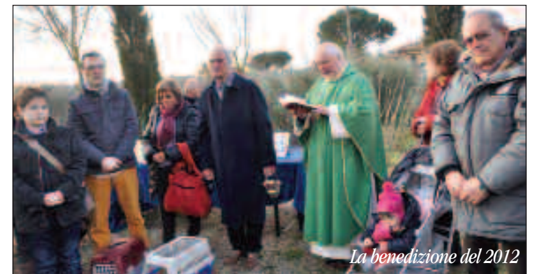
La benedizione del 2012