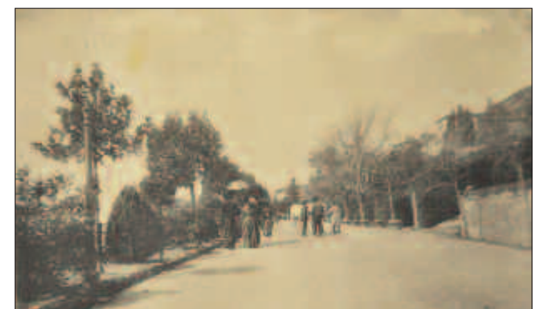
Cortona, 1918. Veduta dei Giardini Pubblici (Collezione Mario Parigi)