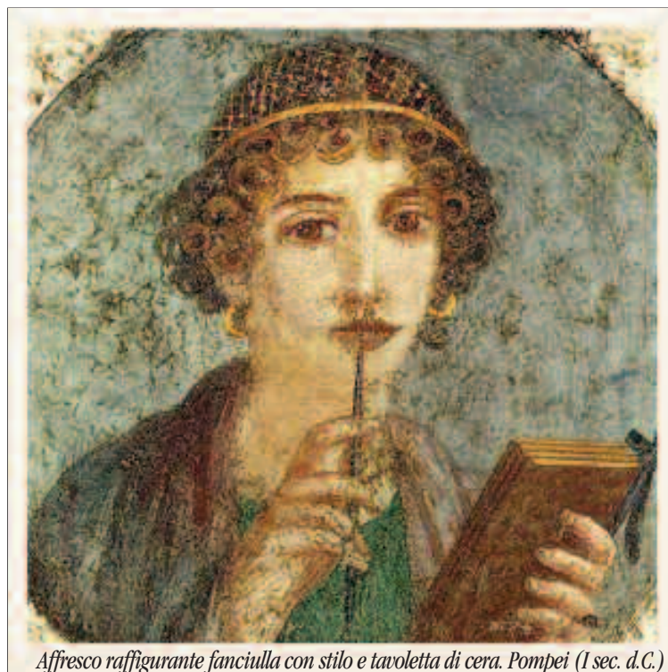
Affresco raffigurante fanciulla con stilo e tavoletta di cera. Pompei (I sec. d.C.)

Altre ancora dovranno essere ritrovate con nuovi scavi e nuove scoperte. Ogni giorno, anche per caso, mentre si costruisce, ci si imbatte in "antichità", ed ogni volta è una conquista ed un passo in avanti per gli studiosi nello sterminato oceano della conoscenza.