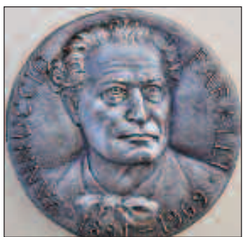
Recto della medaglia

La presenza occhieggiante e rumorosa davanti alla porta a vetri di questi ragazzi, i quali probabilmente detestano tutto quello che in quell'aula - in altri tempi definibile come sorda e grigia - si diceva