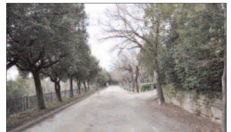
Cortona, 1918. Veduta dei Giardini Pubblici