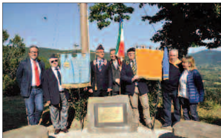
Le associazioni combattentistiche

Molte persone sono giunte al Parterre perché hanno sentito il bisogno di commemorare i 600 cortonesi morti giovani, spesso