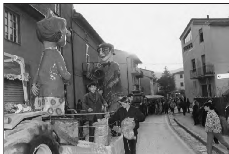
Il Carnevale mercatalese in una passata edizione

presentazioni filodrammatiche. Una cosa, questa, da ritenere indubbiamente positiva in quanto, pur mancando ancora la capacità di ricostituire la Pro Loco, essa rappresenta ora un passo importante verso il superamento della detestata frammentazione in molteplici comitati, spesso antagonisti fra loro e incapaci pertanto di promuovere manifestazioni di consistente rilievo.