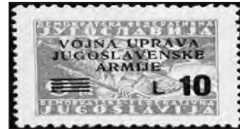
1947 - francobollo jugoslavo sovrastampato per uso postale nella zona B del Territorio Libero di Trieste.