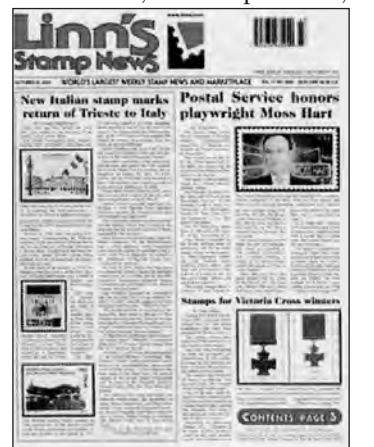
2004 - Copertina di "Linn's stamp news", edita in Usa, con emissione del 50° Anniversario del ritorno di Trieste all'Italia.

Nel frontespizio della prima pagina si evidenziano oltre che l'ultima emissione, anche le precedenti,