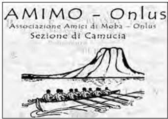
AMI.MO. Il logo dell'Associazione.