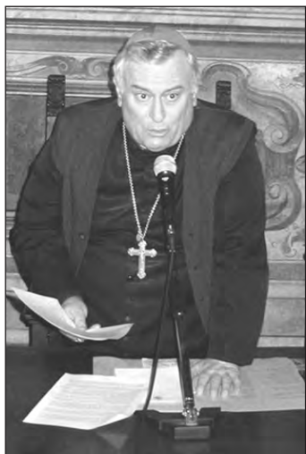
Sua Eccellenza Monsignor Gualtiero Bassetti, Vescovo di Arezzo - Cortona - Sansepolcro.

Monsignor Bassetti ha aperto l'incontro con grande cortesia e rivolgendosi all'attento uditorio ha illustrato con studiata chiarezza e semplicità la posizione della Chiesa nei confronti dei nuovi e vecchi