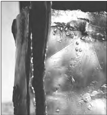
Fogli di sedimentazione

Presenta se la terra, se l'uomo, se il cielo... percorso di scultura di ARMANDA VERDIRAME. La mostra avrà luogo sia in uno spazio aperto: il parco dell'hotel Villa San Paolo Strada provinciale per Certaldo.