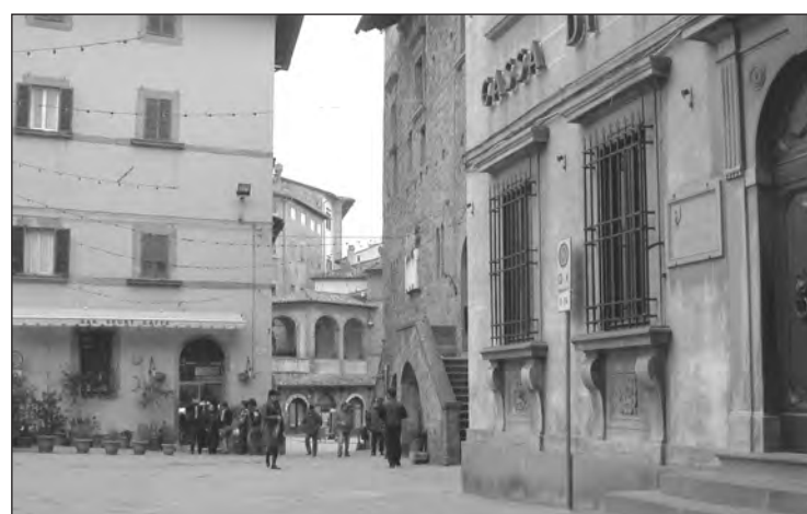
Cortona 2006. Piazza Signorelli con uno scorcio delle Logge di Pesceria.