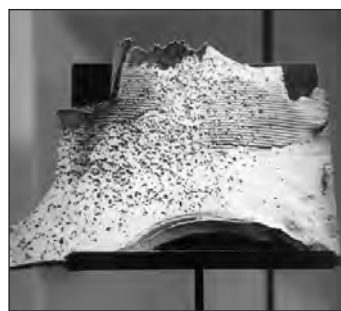
Spartito su leggìo