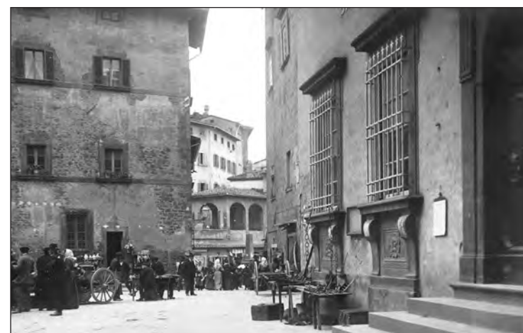
Cortona 1917. Piazza Signorelli con uno scorcio delle Logge di Pesceria.