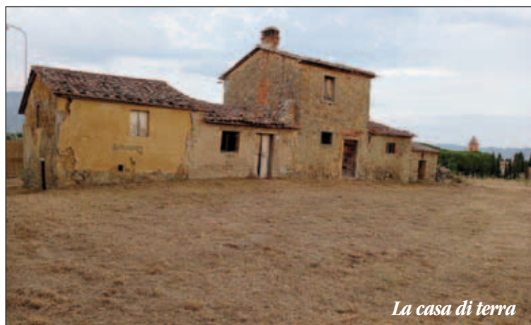
La casa di terra

grande proprietà rendeva l'abitazione calda d'inverno e più fresca nel periodo estivo. Le mura perimetrali della casa venivano costruite con delle grosse tavole che messe in parallelo venivano poi riempite appunto di terra, la terra veniva battuta per renderla compatta, una volta essiccata si provvedeva a spostare i tavoloni più in alto fino ad arrivare al tetto. Il semplice tetto era coperto con tegole e coppi. Le aperture come