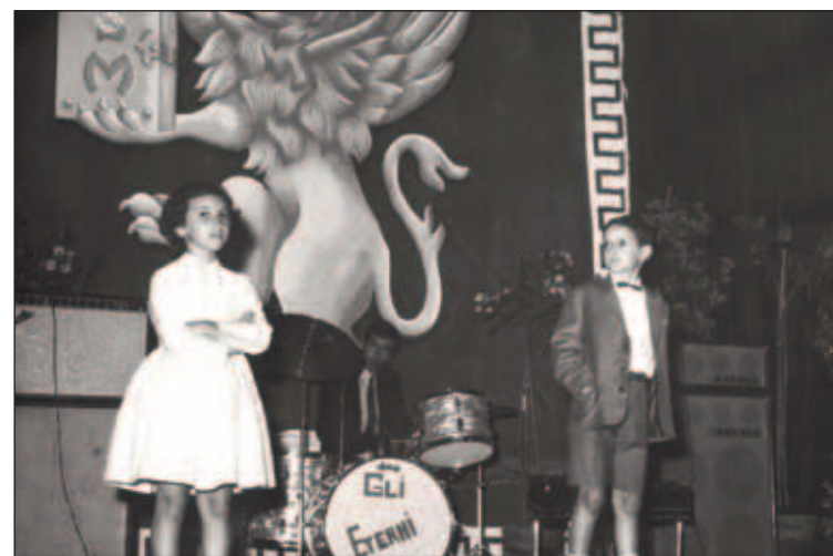
(30 luglio 1967 - Cortona, piazza Signorelli) ... fui eliminato in semifinale da una bambina che cantò benissimo La danza delle sette note di Sandie Shaw.