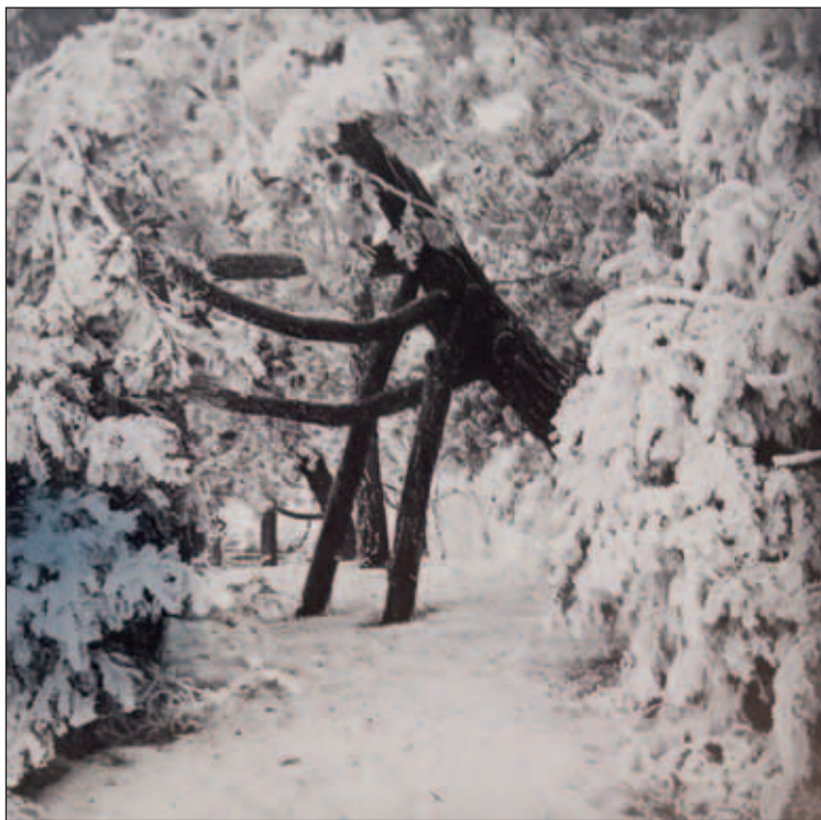
Cortona, bosco sotto la nevicata, primi anni '900.

Il Santo, l'unico con la barba, è in piedi austero e sembra molto adirato con il confratello inginocchiato, mentre gli altri religiosi, tutti molto giovani, assistono all'ammonimento con gli occhi bassi in segno di riverenza. Sullo sfondo si intravedono, tra le macerie, la testa ed il braccio dell'invidioso prete di Subiaco schiacciato da pietre e legni abbattuti dai diavoli posti al di sopra. La vera innovazione sono proprio le figure demoniache e la loro raffigurazione che anticipa, come notato dal grande storico e critico d'arte italiano Mario Salmi (San Giovanni Valdarno, 14 giugno 1889 - Roma, 16 novembre 1980), la pittura della Cappella di San Brizio nel