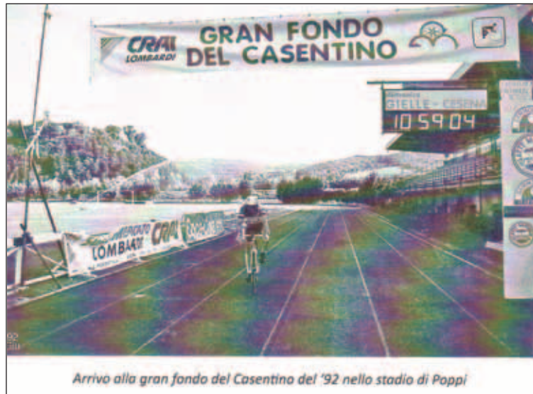
Arrivo alla gran fondo del Casentino del '92 nello stadio di Poppi