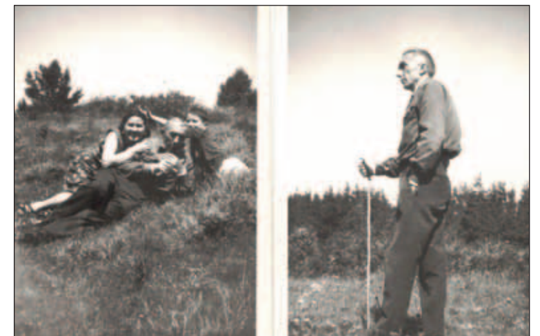
(1967 S. Egidio) - ...una zona pianeggiante, si dominava tutta la valle. Qui passavamo la nostra giornata scherzando e giocando...

Durante l'estate S. Egidio era molto frequentato dai cortonesi. Decine di famiglie, nei giorni di festa, salivano verso la vicina montagna